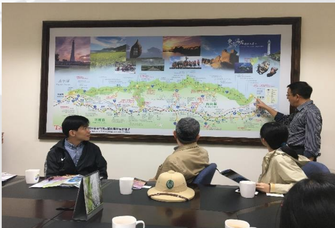
▲台東教師增能活動－東部海岸風景管理處考察